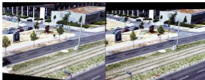
Fig. 4. Original images of the example scene

Das Ziel dieser Arbeit soll die Fahrzeugwiedererkennung basierend auf 3D Informationen: Dazu wird ein 3D-Modell aus den Synchronkameras abgeleitet und mit der Monokamera verifiziert. Die gleichzeitige Aufnahme ermöglicht eine Objekterkennung und Objektrekonstruktion entsprechend der folgenden Abbildung: